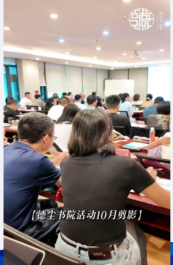
【德尘书院活动10月剪影】