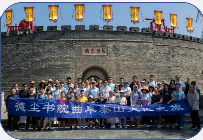
山东曲阜泰山文化之旅