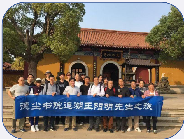
江西追溯阳明先生之旅