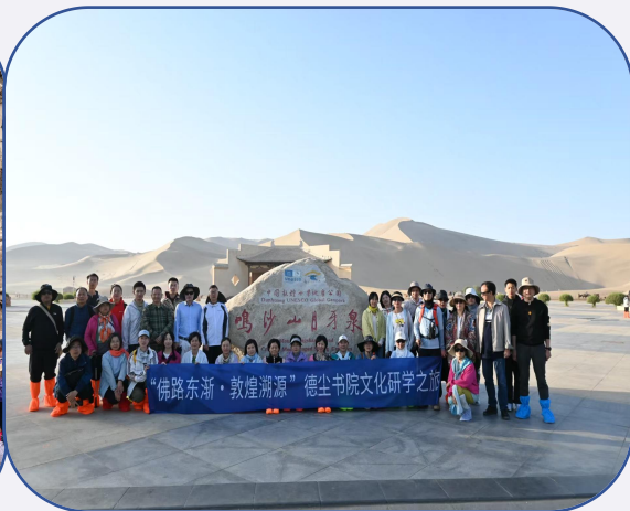
敦煌溯源文化之旅

2025年9月组织了“佛路东渐·敦煌溯源”文化研学之旅，这一为期六天的深度研学，以佛教从印度经西域传入中原为主线，串联兰州、张掖、嘉峪关、敦煌四大节点，通过学术讲座、洞窟探秘、非遗体验等多元形式，构建起历史脉络梳理—艺术密码解析—文明互鉴实践的立体学习场域。