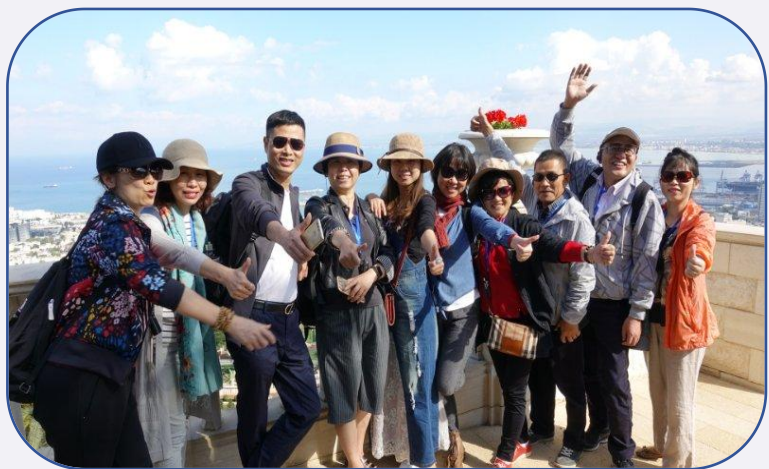
耶路撒冷文化之旅

国际线路：组织耶路撒冷文化之旅、日本阳明学溯源、印度佛教圣地探访等跨国研学，累计带领150余名学员走出国门。